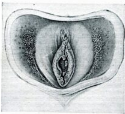
Papillen an den kleinen Schamlippen Nach B. Lipschütz

Nach Lipschütz (1924) in Bauer (1930) besitzen die während der Pubertät auftretenden Papillen der inneren Vulvalippen eine hohe Dichte an sensorischen Nervenendigungen und können deshalb als «Wollustapparat» dienen. Beim Penis Kranz von Hautstacheln an der Corona glandis.