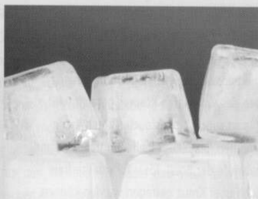
Bei Entzündungen hilft die Massage mit in einer Tüte und einem Waschlappen eingepackten Eiswürfeln.

Nur in seltenen Fällen, in denen sich mit den oben beschriebenen Maßnahmen keine Besserung erreichen lässt, muss der behandelnde Arzt mit weiteren Untersuchungsmaßnahmen (Röntgen, Kernspintomographie) eine Stressfraktur ausschließen. In Einzelfällen kann ein Kompartmentsyndrom ähnliche Beschwerden verursachen.